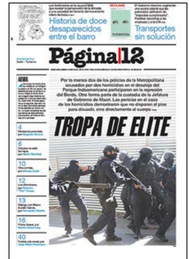
La tapa en la cual remarca la violencia de la Metropolitana.

Como contrapartida genera que estos lectores busquen otras opciones que mantengan más distancia en relación con la política, y apunten más objetivamente a la hora de informarlos. Lo que implica una pérdida de confianza hacia los medios politizados. ■