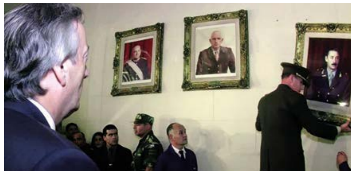
El expresidente Néstor Kirchner bajando el cuadro de Videla en la ESMA.