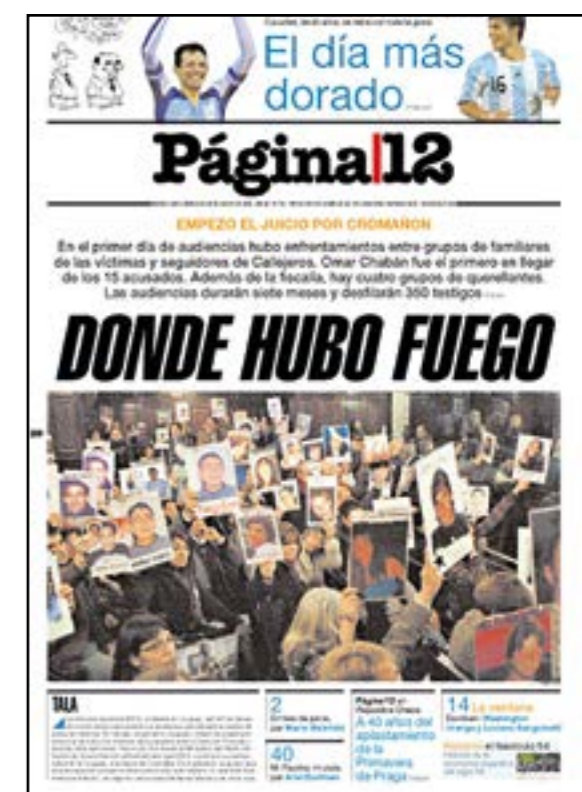
Tapa del día después de las audiencias en el juicio de Cromagnon

No es que las fuerzas de seguridad y los penitenciarios sean la oposición. Son parte en todo caso de un sistema degradado que ni los actuales ni anteriores gobiernos pudieron jamás poner en caja. Y vuelvo con algo: es saludable que se profundice con estas cuestiones pero también lo es ahondar en los problemas de seguridad que sin duda reconocen una raíz social pero a la que el estado, representado por el gobierno que quieras de treinta años para acá, atendió como debiera haber sido. En todo caso y para cerrar los abordajes editoriales respecto a la aberrante práctica de la violencia institucional, es el propio esquema político el que termina alimentando los vejámenes, represión y abusos que algunos, como es fácil comprobar, no tienen demasiados pruritos en ejecutar. ■