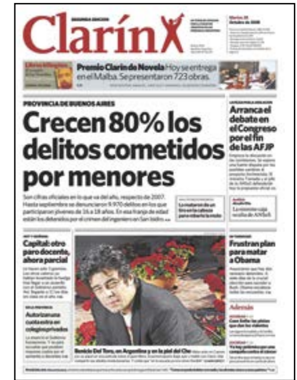
Tapa diario Clarín y su tratamiento de las noticias

De esta manera se aprecia evidentemente cómo los medios trabajan la información de acuerdo a las líneas a las que responden. Lo que provoca es que el lector sea el que tiene que decidir permanentemente de qué lado se ubica, pues por una parte tiene a un medio como Clarín, que muestra el fracaso de la política a la hora de disminuir el índice de crímenes, y por el otro lado, el diario que revela que el exceso de coacción por parte de las fuerzas de seguridad va en contra de los declarados derechos del hombre. ■