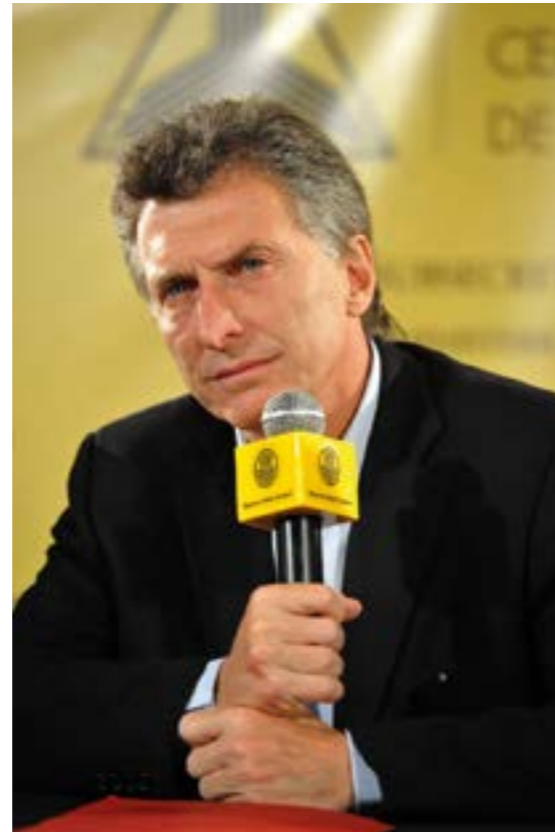
Mauricio Macri en rueda de prensa

Entre los objetivos del matutino está el de remarcar las privatizaciones que lleva o llevó a cabo el empresario, haciendo un paralelismo con los años ‘90. Ejem-