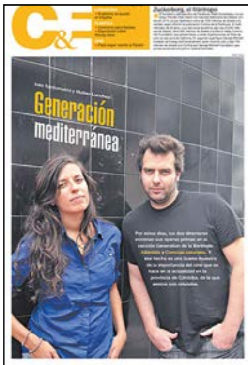
Su sección Cultura & Espectáculos

Para esta tarea, se tomaron las ediciones del 4 al 13 de mayo del corriente año, en donde se vislumbran las prioridades de Página|12 a la hora de informar al ciudadano. Para ello, comienza con la sección El País, por medio de la cual, desde la cara interna de la tapa, desarrolla de manera extensa el tema del día.