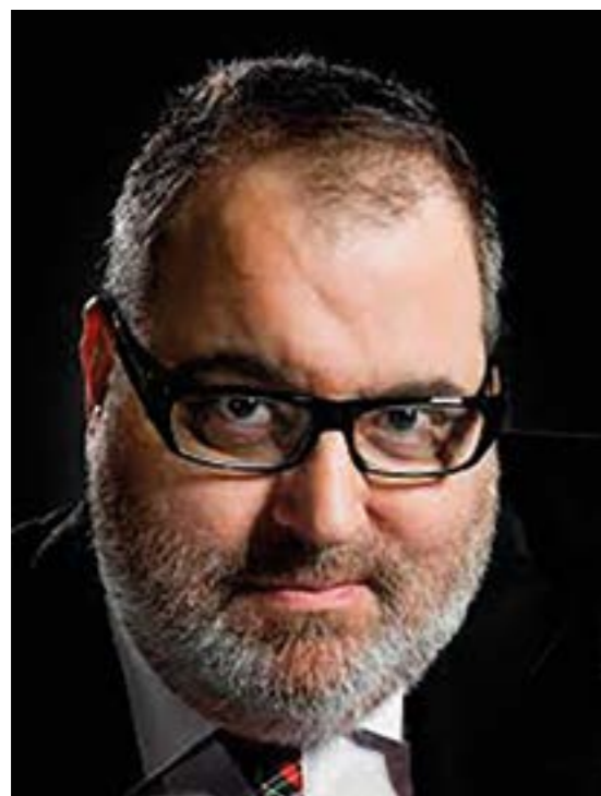
Jorge Lanata fundador de Página|12.

Un recorrido por las raíces de Página|12 y la manera de cómo llegó a transformar el periodismo tradicional.