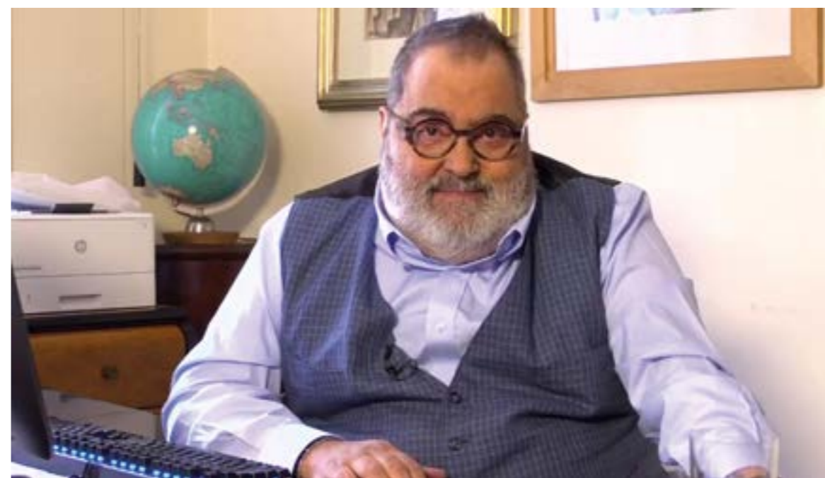
Jorge Lanata en su oficina

A lo largo de los años, Página mutó su lineamiento político, ya que en sus inicios solía ser muy crítico con los que ejercían la administración del país, sobre todo en el gobierno de Carlos Menem, luego continuó con este estilo durante la gestión de Fernando De la Rúa, y cambió de eje con la llegada de Néstor Kirchner al poder.