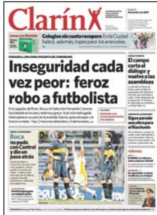
Tapa diario Clarín

De manera que elabora este tipo de información en una sección especial, la cual se denomina Policiales, en donde se prioriza la inseguridad que afecta a las