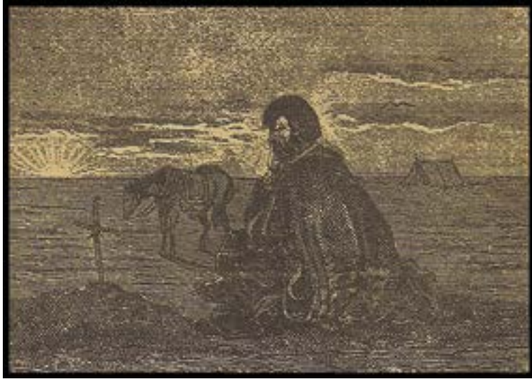
Martín Fierro meditando en la tumba de su amigo Cruz