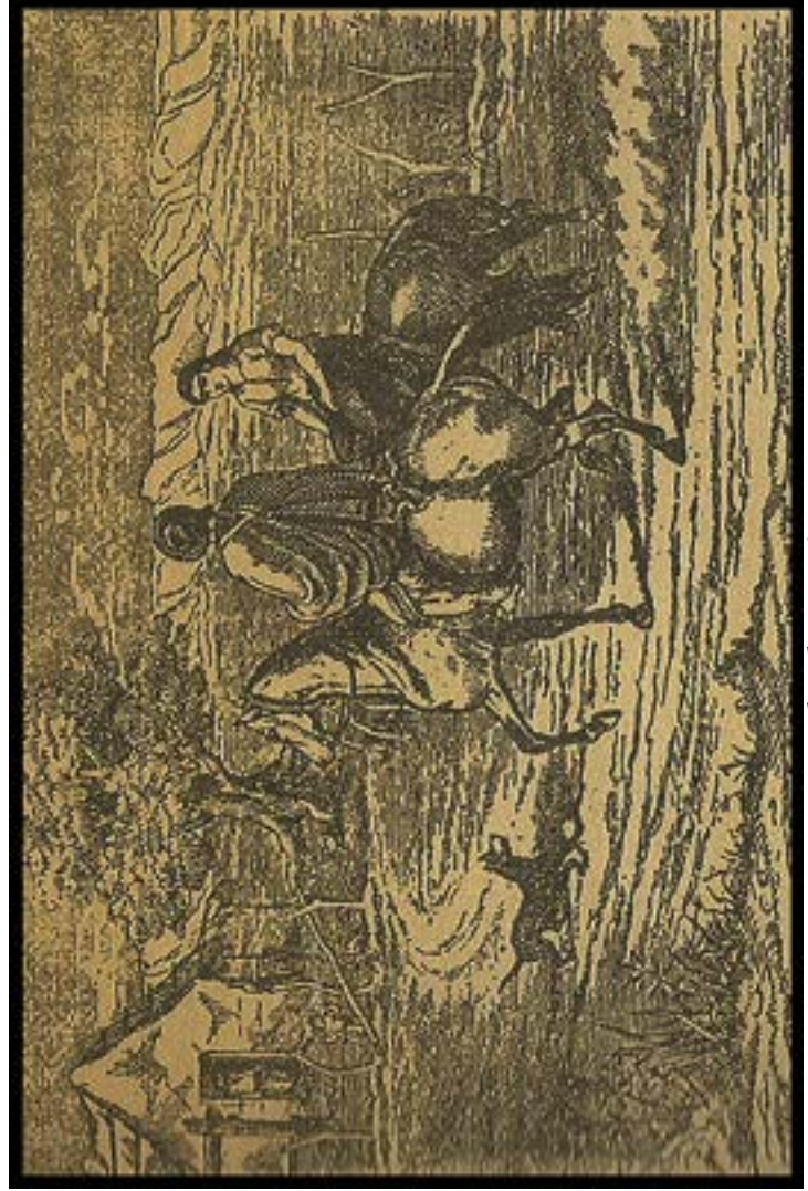
Vuelta de Martín Fierro