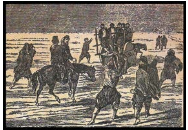
La vuelta del Contingente