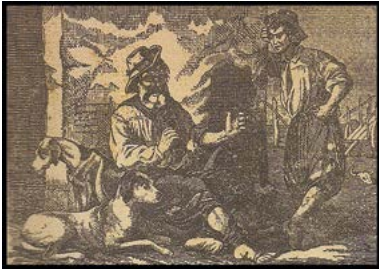
El viejo vizcacha dando sus consejos