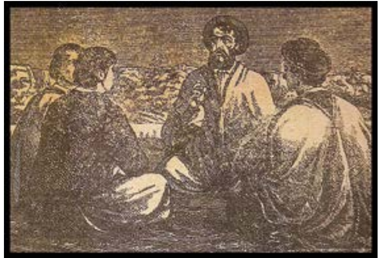
Martín Fierro dando consejos a sus hijos