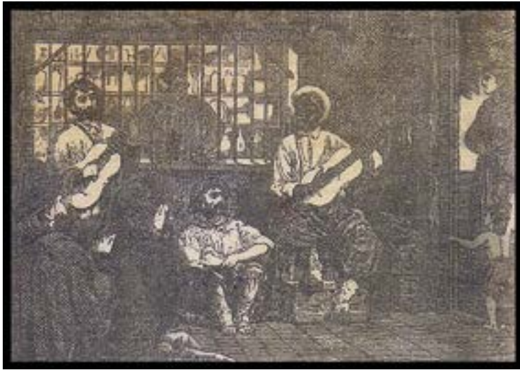
Canto por cifra, de contrapunto entre Martín Fierro y un negro