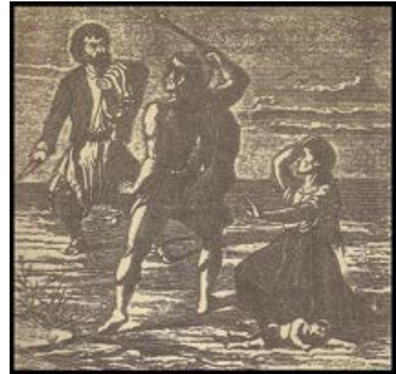
Pelea de Martín Fierro con un Indio