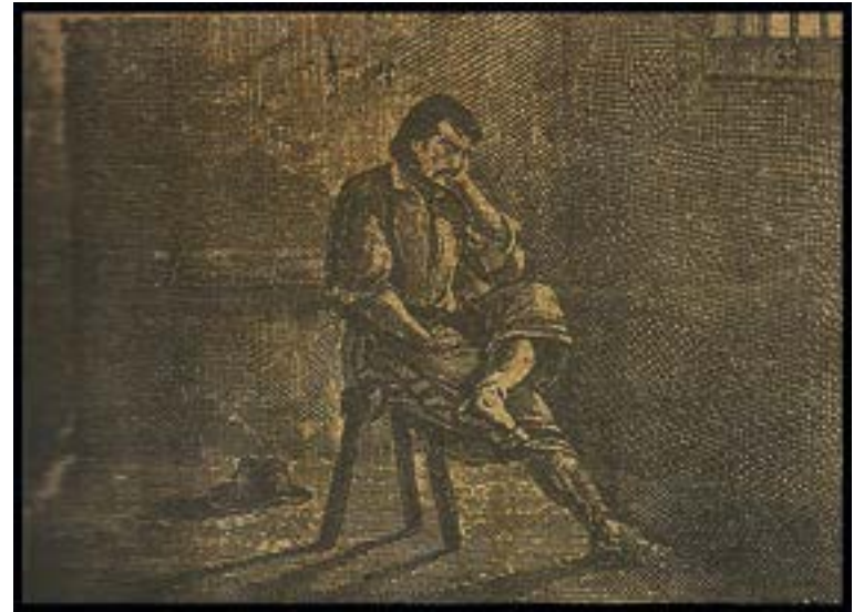
En la penitenciaría